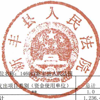
2018年部门预算基本支出预算表