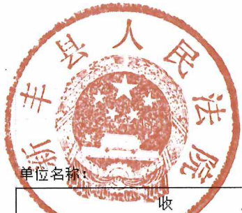
财政拨款收支总体情况表