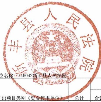
2018年部门预算项目支出预算表