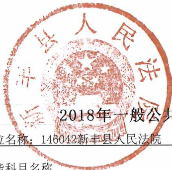
2018年一般公共预算支出情况表（按功能分类科目）